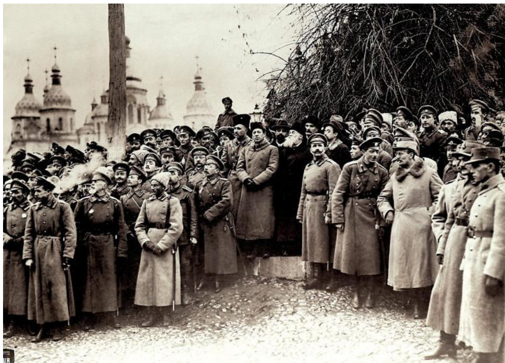
Мітинг з нагоди відкриття III Всеукраїнського військового з'їзду (в центрі – Симон Петлюра, Михайло Грушевський та Володимир Винниченко). Листопад 1917 року