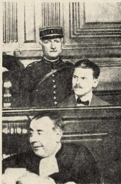
Шварцбард на скамье подсудимых, впереди Торрès.

— Я спрашивал всех своих знакомых, где же точно находится Петлюра. С каким невыразимым презрением все мне отвечали, что не хотят даже произносить имя этого человека. Однажды мне попала в руки его фотография, я ее захватил с собой и стал носить при себе револьвер. Но я хотел быть уверенным, что пуля попадет именно тому, в кого она предназначена. 25 мая 1926 г. я встретил убийцу... Когда я увидел, что он выходит из ресторана на улице Расина, я посмотрел ему в лицо и крикнул: „Пан Петлюра?!“