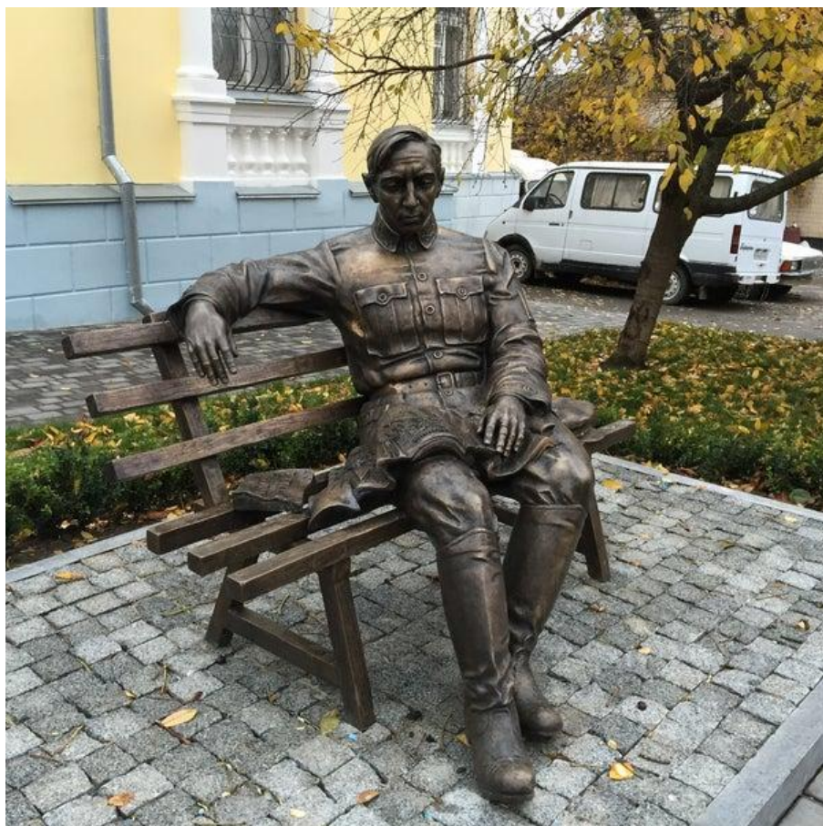
Пам'ятник Симону Петлюрі