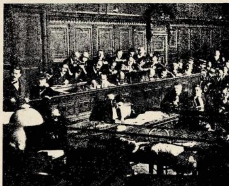
Суд над Шварцбардом.