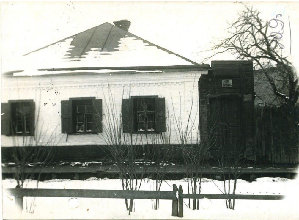
Будинок родини Симона Петлюри (вигляд з вулиці). 1937 рік