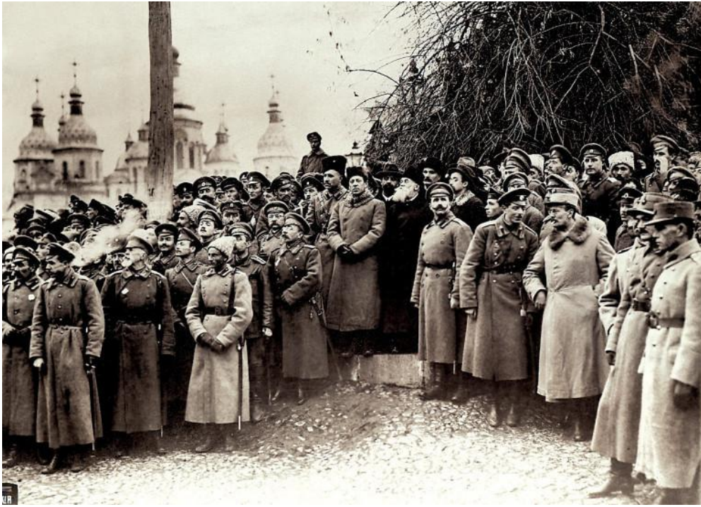
Мітинг з нагоди відкриття III Всеукраїнського військового з'їзду (в центрі – Симон Петлюра, Михайло Грушевський та Володимир Винниченко). Листопад 1917 року