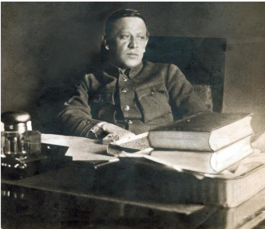
Одне із останніх фото Симона Петлюри. 1925 рік