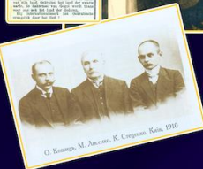
Симон Петлюра, Голова Директорії Головного отаман військ і флоту УНР, ініціатор створення Української Республіканської Капели

Фотовиставка “Культурна дипломатія України: світовий триумф Щедрика” – про неймовірний резонанс світового турне Української Республіканської Капели. У добу Української революції, коли небувалого розмаху набув хоровий рух, голова Директорії УНР Симон Петлюра задумав популяризувати Україну за кордоном за допомогою пісні. В січні 1919 року він доручив диригентам Олександрові Кошицю та Кирилові Стеценку організувати колектив і вирушити у турне. Чому саме Кошицю? Бо вони приятелювали ще з часів учителювання на Кубані. Гастролі принесли славу як Кошицю, так і українській пісні, а різдвяний “Щедрик” Миколи Леонтовича став улюбленим у багатьох країнах Європи та Америки. Репертуар Української республіканської капели складався виключно із народних пісень в обробці Миколи Лисенка, Кирила Стеценка, Олександра Кошиця, Миколи Леонтовича.